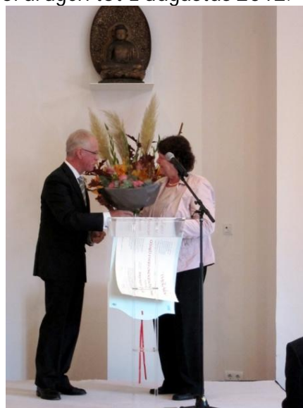
Uitreiking GEO 2010.

kunnen hiervoor kandidaten voordragen tot 1 augustus 2012.