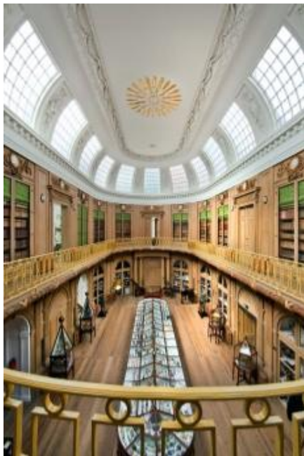
De ovale zaal van het Teylers Museum

De Vriendenvereniging van het Frans Hals Museum bestaat in 2012 25 jaar. Het museum heeft uiteraard een grote collectie schilderijen van de Haarlemse schilder Frans Hals. Maar er zijn ook topstukken te zien van vele andere prominente schilders uit de 16 e en 17 e eeuw. Meer informatie vindt u op www.franshalsmuseum.nl