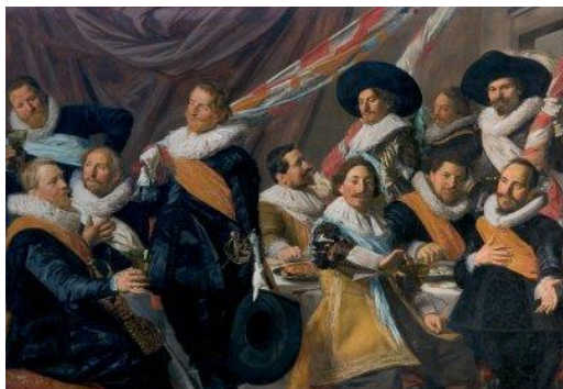
Officieren van de Sint Joris schutterij.

Het Teylers Museum is het oudste museum van Nederland. Tijdens de ledendag is daar onder meer de Rafael tentoonstelling te zien. De website van dit museum is www.Teylersmuseum.nl