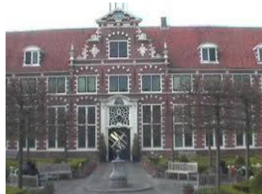
Frans Hals Museum